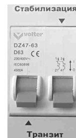
Рис.6 Отключены оба режима.