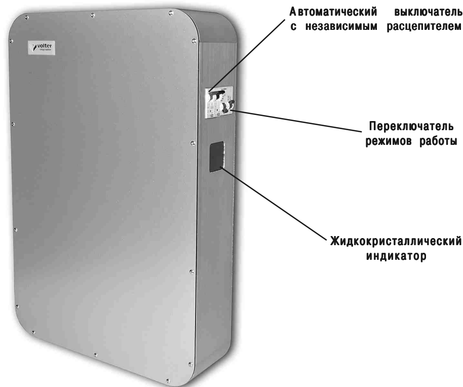
Рис. 1. Стабилизатор напряжения

В верхней части расположен клеммник, для подключения стабилизатора, закрытый крышкой. Там же расположен заземляющий контакт.