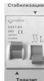
Рис.7 Режим «Транзит».

1. Выключите автоматический выключатель на боковой панели стабилизатора (вниз).