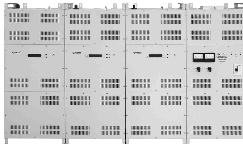
Рис. 1. Стабилизатор напряжения

Блоки стабилизатора состоят из 3-х отсеков. Для крепления к стене каждый блок имеет специальные петли в верхней части. Для крепления к полу используются отверстия в ножках блоков.